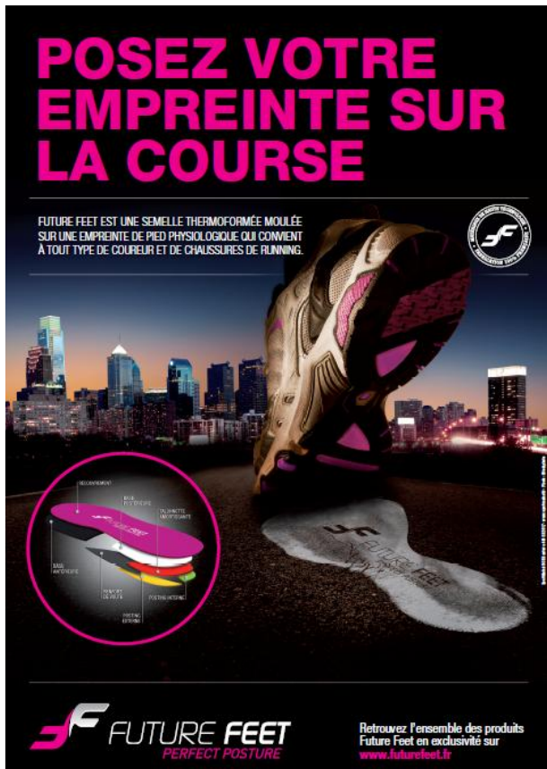
Annonce presse – modèle Femme